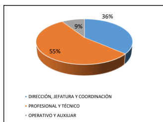
GRÁFICO Nº 2 DIMENSIONES COMPETENCIALES DEL CARGO